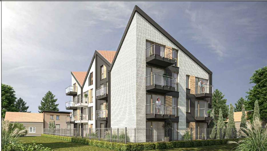
WIZUALIZACJA OD STRONY PARKU I JEZ. MAGISTRACKIEGO